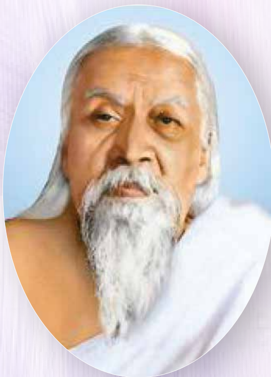
SRI AUROBINDO GHOSH (1872 - 1950)

SRI AUROBINDO COLLEGE (University of Delhi)